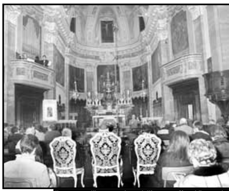
Il concerto d'inaugurazione dell'organo